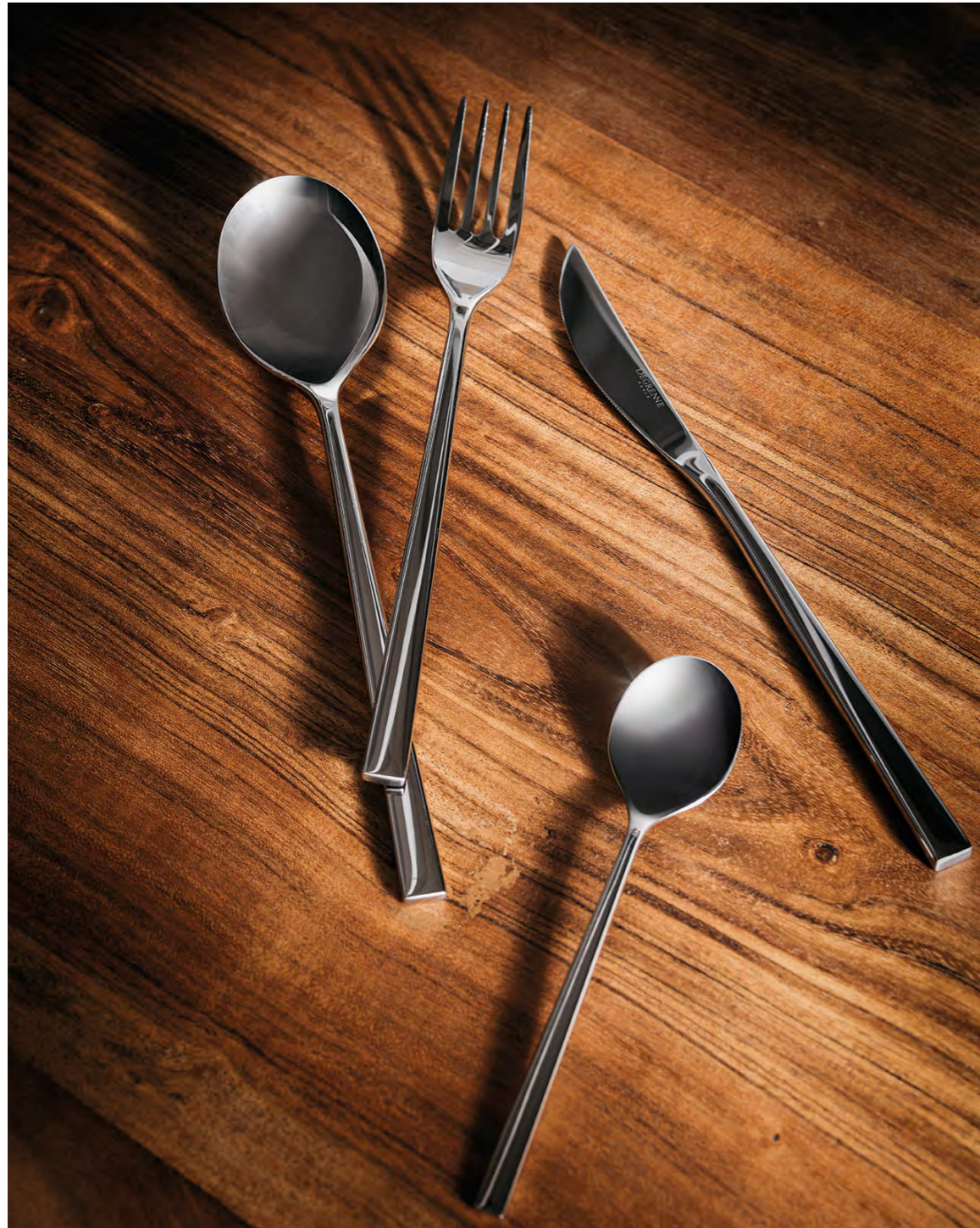
FUSE MIROIR MIRROR